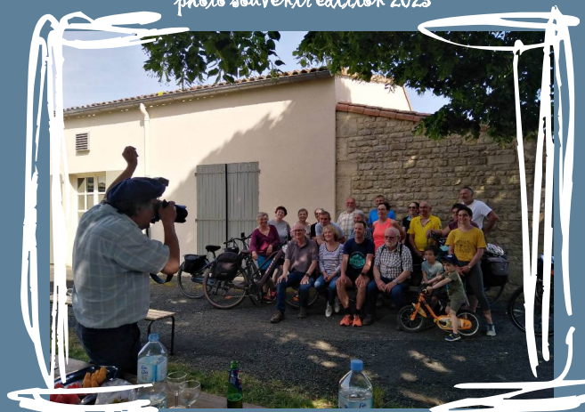
photo souvenir édition 2023

Après la belle réussite de l'édition 2023, les participants qui se sont réunis au Moulin du Marais en octobre dernier avaient tous la volonté de renouveler l'expérience. Mais l'aventure de 2023 devant rester un moment unique et singulier, le choix a été fait d'imaginer une nouvelle aventure audacieuse, à plus petite échelle pour 2024, et plus audacieuse pour 2025.